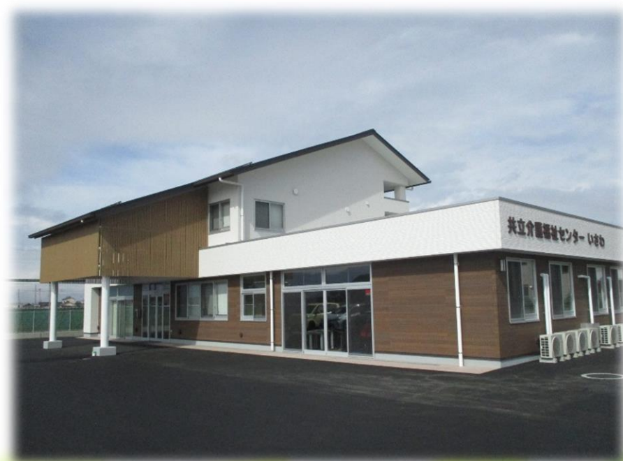
【いさわセンター外観。ご来場の際、ご参照ください。】