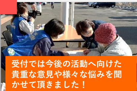
受付では今後の活動へ向けた 貴重な意見や様々な悩みを聞 かせて頂きました！