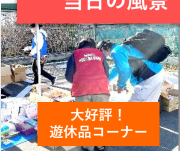
大好評！ 遊休品コーナー