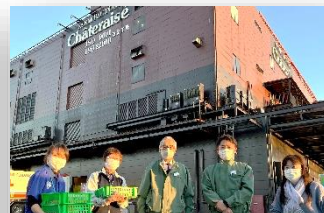
大きな工場にも行きました！！