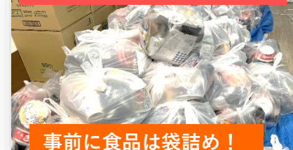
事前に食品は袋詰め！