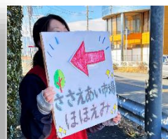
職員が会場へ誘 導しました

コロナ禍で生活が困窮している方へお米やレトルト食品、日用品を無償提供する「ささえあい市場 ほほえみ」を12月19日（日）に開催しました。この企画を通して地域住民の声を聴く機会、企業や団体と繋がる機会、職員が地域を知る機会になりました。72名の方がご参加してくださりました。今後も共立介護福祉センターいさわでは地域での困っている方への声を聴き支援していく活動を続けていきます。