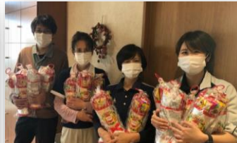
お子さんにサンタさんか らもプレゼントが・・・