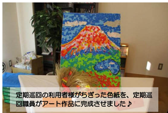
定期巡回の利用者様がちぎった色紙を、定期巡回職員がアート作品に完成させました♪