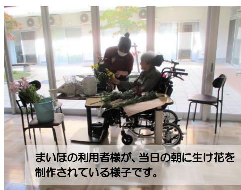
まいほの利用者様が、当日の朝に生け花を制作されている様子です。