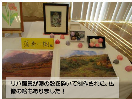
りハ職員が卵の殻を砕いて制作された、仏像の絵もありました！