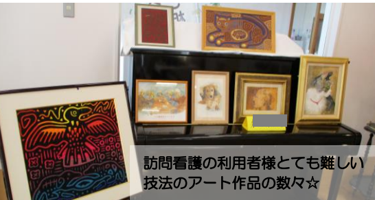
訪問看護の利用者様とても難しい技法のアート作品の数々☆