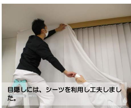
目隠しには、シーツを利用し工夫しました。