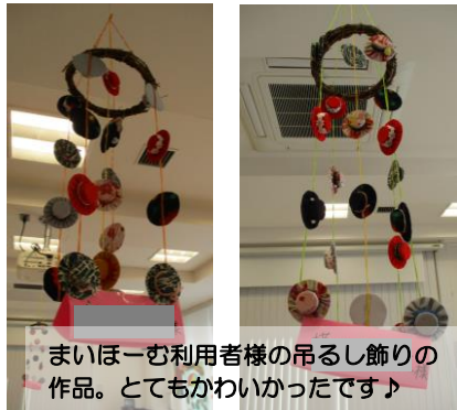
まいほ一む利用者様の吊り飾りの作品。とてもかわいかったです♪