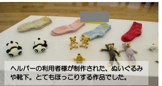
ヘルパーの利用者様が制作された、ぬいぐるみや靴下。とてもほっこりする作品でした。