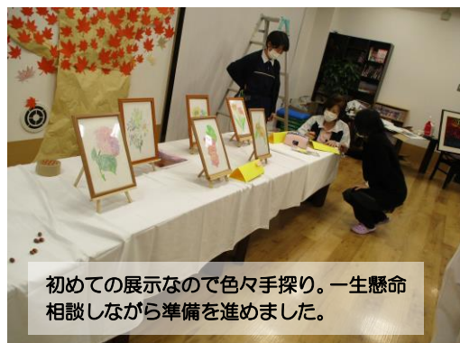
初めての展示なので色々手探り。一生懸命相談しながら準備を進めました。