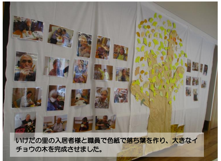
いけだの里の入居者様と職員で色紙で落ち葉を作り、大きなイチョウの木を完成させました。