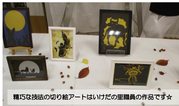
精巧な技法の切り絵アートはいけだの里職員の作品です☆