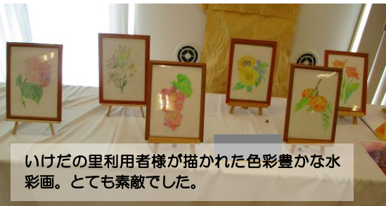
いけだの里利用者様が描かれた色彩豊かな水彩画。とても素敵でした。