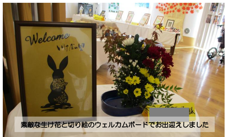
素敵な生け花と切り絵のウェルカムボードでお出迎えしました