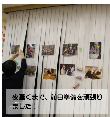
夜遅くまで、前日準備を頑張りました！