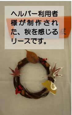
ヘルパー利用者様が制作された、秋を感じるリースです。