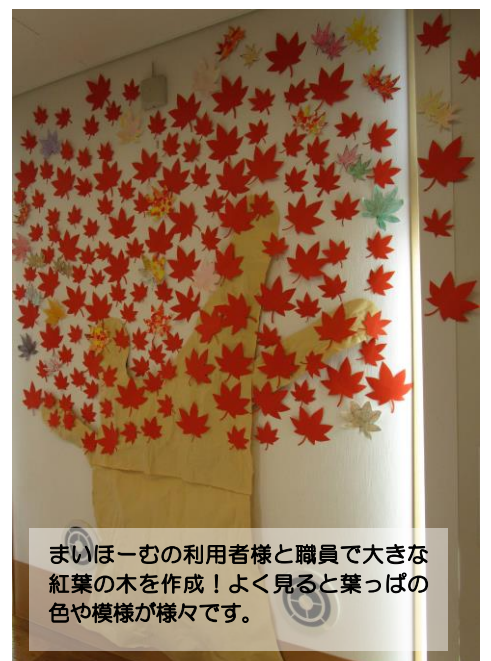
まいほ一むの利用者様と職員で大きな紅葉の木を作成！よく見ると葉っぱの色や模様が様々です。

利用者様もとても嬉しそうなお様子でした。ご家族様の参加もありがとうございました。来年の秋祭りに向け創作意欲が高まる2日間となりました。(名取)