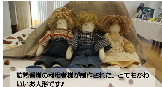
訪問看護の利用者様が制作された、とてもかわいいお人形です♪