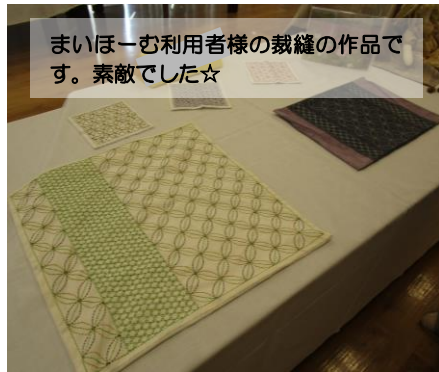
まいほ一む利用者様の裁縫の作品です。素敵でした☆