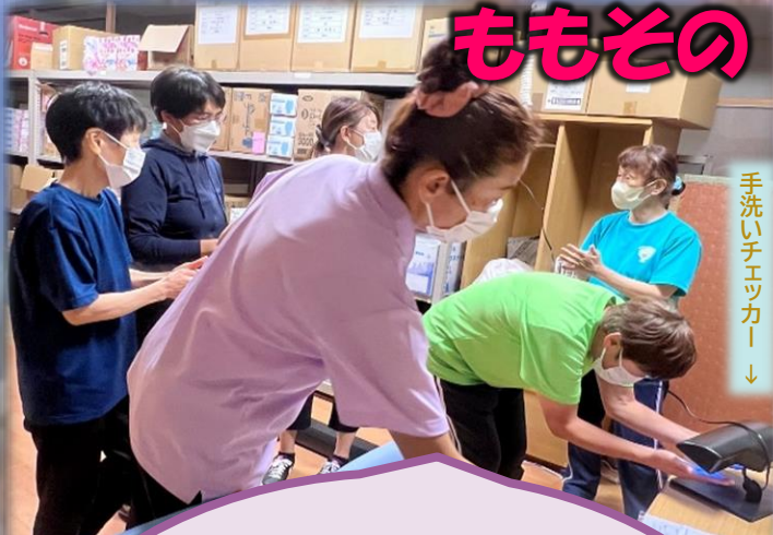
手洗いチェックカー ↓

ヘルパー会議にて、感染・食中毒について学習しました(〽) 私達ヘルパーはご利用者が安心してご自宅で生活を続けられるよう、毎月テーマを決めて 研修し、みんなで学習 しています♡♡