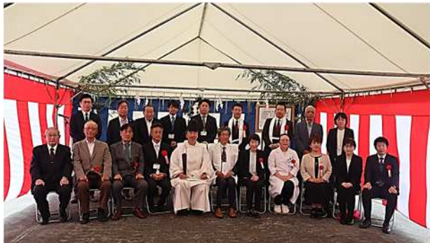
式典終了後の記念撮影の様子

5月15日晴天の下、まいほーむもその起工式を行いました。理事長をはじめ、南アルプス市役所保健福祉部長様、地域の区長様、友の会会長様、山梨民医連の多くの方々や設計士・施工会社の方々にご出席頂き、安全を皆様で祈願致しました。待ちに待った工事が本格的に始まります！ 共立介護福祉センターももその職員一同これからも一丸となり頑張っていく予定です！