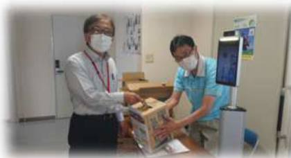
山梨民医連のリハビリ職員研修会で寄付訴え