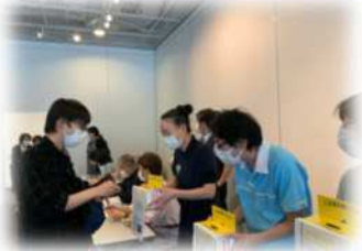
県健康友の会総会での寄付金の訴え