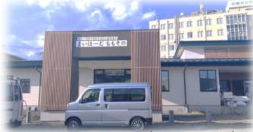
まいほーむもその看板のイメージ