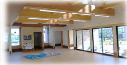
明るく天井の高いフロア