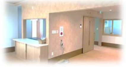
キッチンにはカウンターも付けました