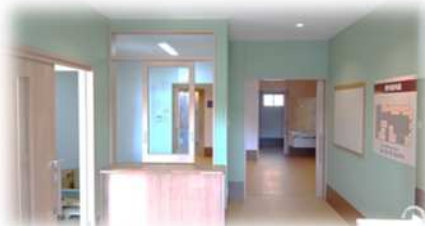
落ち着いた色の玄関