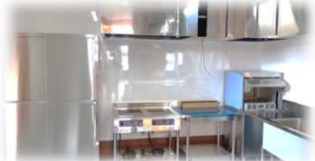
調理機器も設置されました